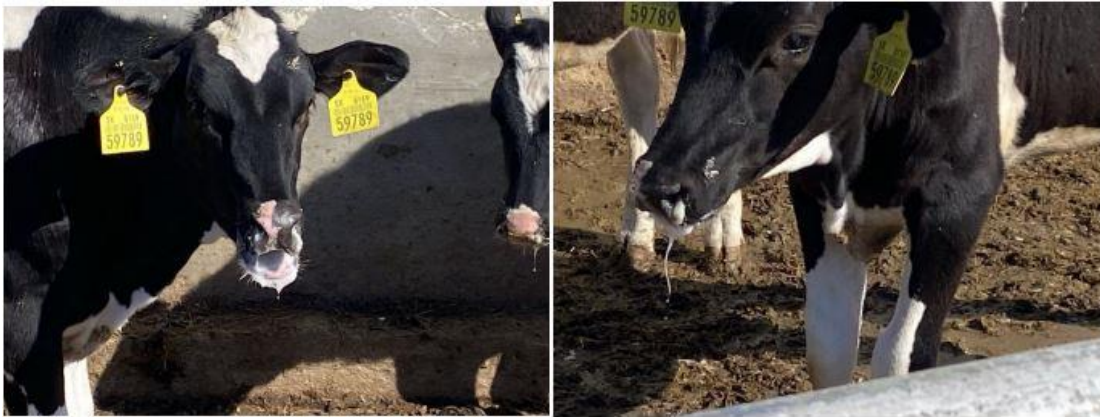
CLINICAL SIGNS – OUTBREAK No. 5 (SK-FMD-2025-00005)